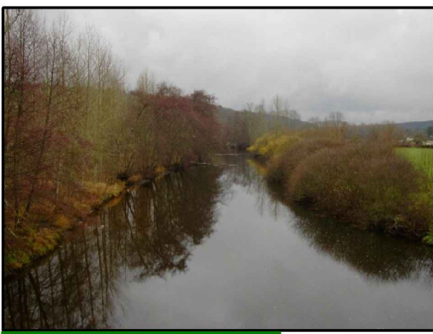
La Cure en aval du pont de Blannay

1866 : côte NGF 135,044 m 20 janvier 1910 : côte NGF 135,11 m