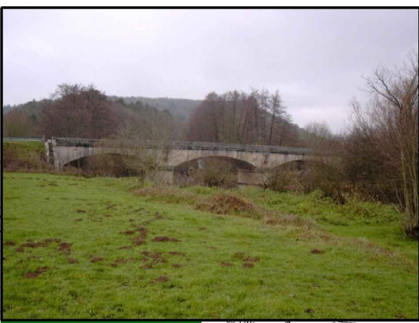
Pont de Blannay (RD 951)

1866 : côte NGF 135,044 m 20 janvier 1910 : côte NGF 135,11 m